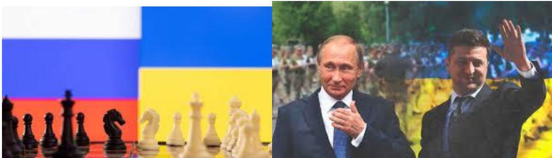
Tablero. Acuerdan retomar el proceso de paz. Putin y Zelensky (10-12-19)

Para Estados Unidos y sus aliados, esta es la llamada política de contención de Rusia, de evidentes dividendos geopolíticos. Y para nuestro país esto es en última instancia una cuestión de vida o muerte, una cuestión de nuestro futuro histórico como pueblo. Y esto no es una exageración, es cierto. Esta es una amenaza real no solo para nuestros intereses, sino también para la existencia misma de nuestro Estado, para su soberanía. Esta es la línea muy roja de la que se ha hablado muchas veces. La han cruzado.