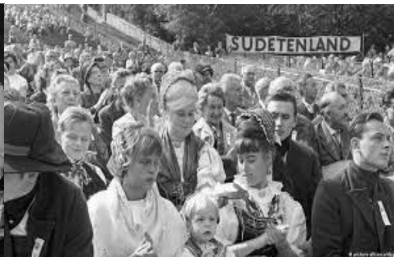
Conmemoración dela anexión

Parte del Discurso del presidente ruso, Vladímir Putin, en el que anunció la madrugada del jueves 24 de febrero el comienzo de la operación militar especial en Ucrania.