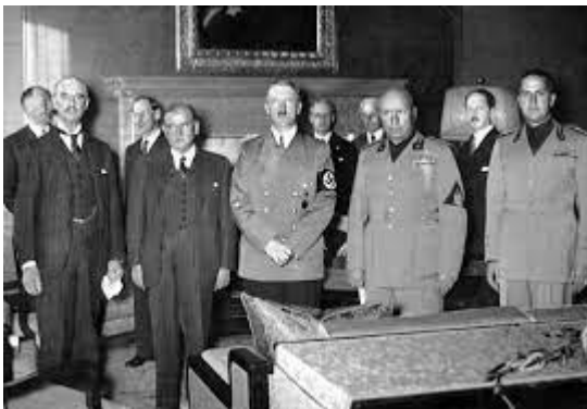
Pacto de Múnich/miedo en Europa

conmigo, sentirá que mi voluntad es su voluntad! Del mismo modo que su futuro y su destino son la fuerza que me lleva a actuar de este modo. Ahora queremos que nuestra voluntad sea tan fuerte como en el momento de nuestra lucha, el momento en que yo, un simple soldado desconocido, conquistó un imperio y nunca dudó del éxito ni de la victoria final.