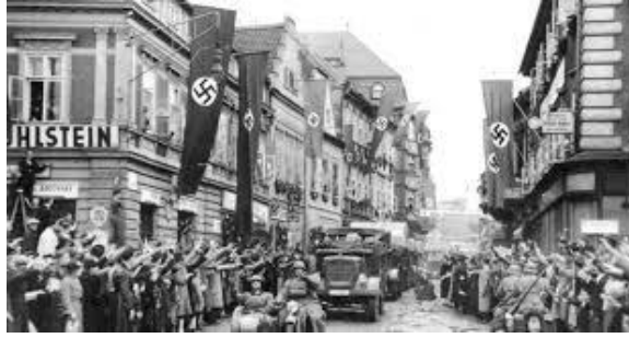
Europa abandona a Checoeslovaquia