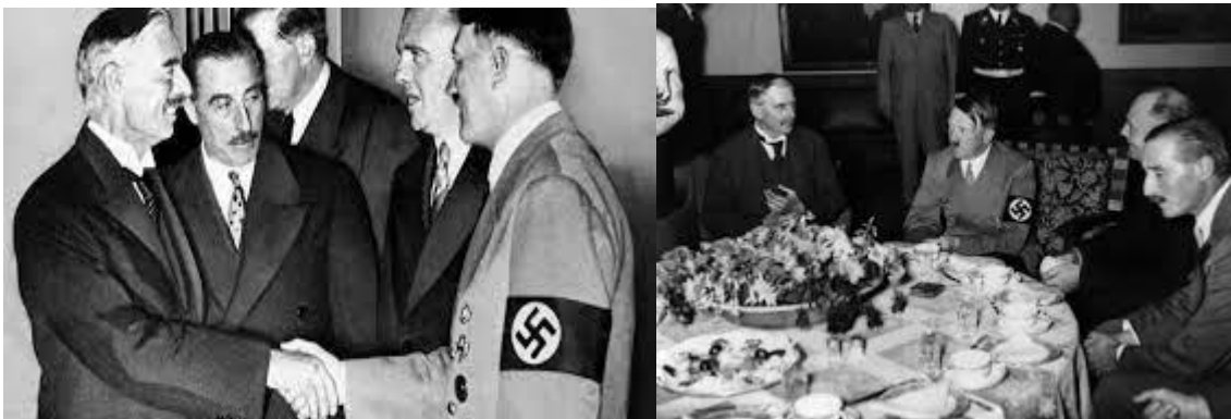
Chamberlain, adalid del apaciguamiento (Wikipedia)

Tan solo quisiera decir un par de cosas más: estoy agradecido al señor Chamberlain por todos sus esfuerzos. Le he asegurado que no hay nada que el pueblo alemán anhele más que la paz, pero también le he dicho que no puedo ir más allá de los límites de nuestra paciencia. También le he asegurado, y lo repito aquí, que cuando este problema se haya resuelto, para Alemania se habrán acabado los problemas territoriales de Europa. Y le he asegurado que en el momento en que Checoslovaquia solucione sus problemas, lo que significa que los checos alcancen un acuerdo con sus otras minorías, y mediante medios pacíficos y no la opresión, entonces cesará todo mi interés por el Estado checo. ¡Y se lo he prometido! ¡No queremos a los checos!