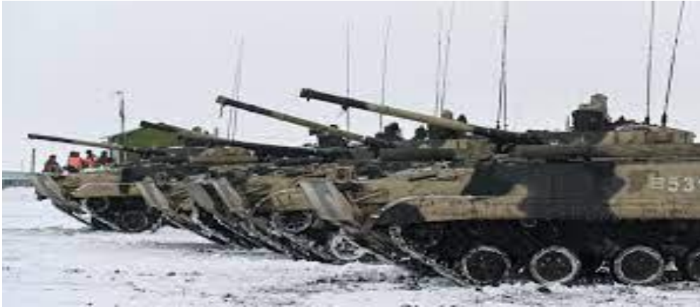
¿Es demasiado tarde?

AHORA VIENEN POR MI, PERO ES DEMASIADO TARDE»